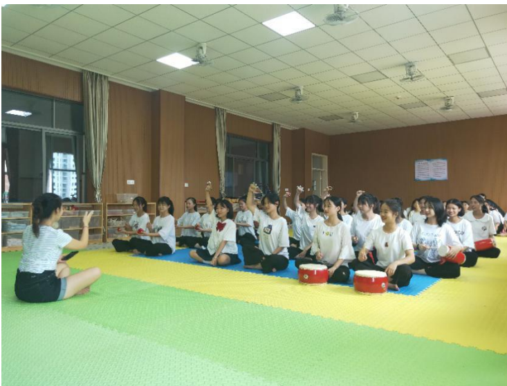
学前教育专业学生在进行奥尔夫音乐教学活动