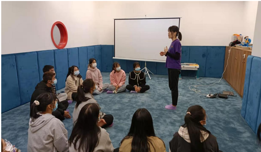
早期教育专业的学生在早教机构学习，践行“校企双师制”培养模式