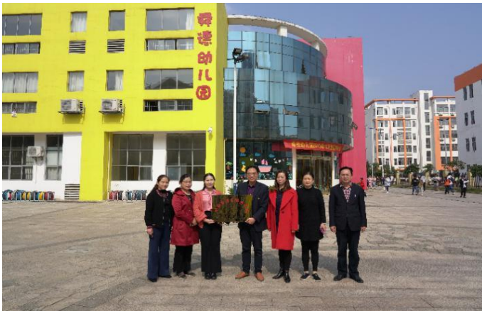
学前教育学院与舜德幼儿园签订校企合作协议