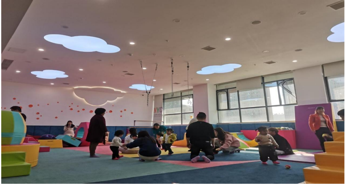
早期教育专业的学生在早教机构进行见习