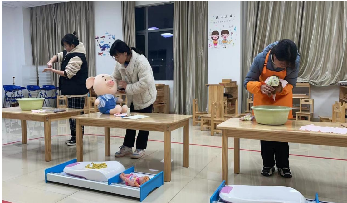
早期教育专业的学生在校实训室进行婴幼儿照护实训

就业方向： 早教指导师、幼儿园教师、保育员、育婴师、儿童社会工作者、社区幼教机构工作者。还可入职幼儿玩教具公司、艺术培训机构、儿童运动与游乐中心、社会福利机构、儿童图书出版公司及相关产业从事咨询、指导等工作。