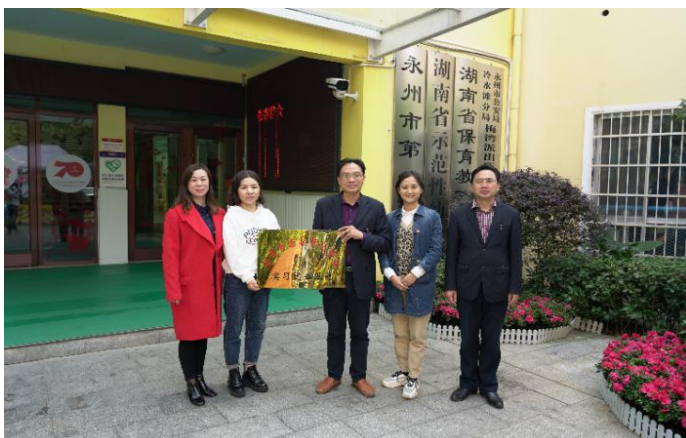
学前教育学院与永州市第一幼儿园签订校企合作协议