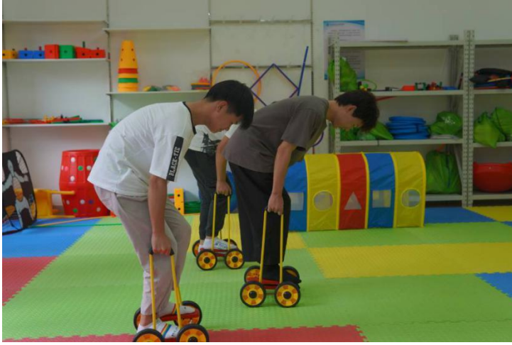
学生在感统教室 体验感觉统合训 练教具