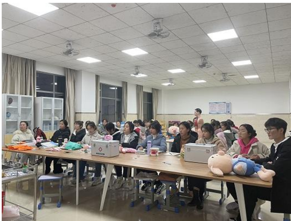
1+X 幼儿照护技能等级考试培训

就业方向： 幼儿园、早教机构及幼儿培训机构教师、幼教机构保育员、儿童社会工作者、社区幼教机构工作者、儿童运动研究机构指导师、儿童健康与发展机构初级工作者。