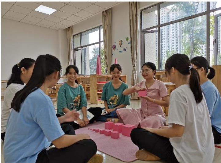
学前教育专业学生在蒙台梭利教师探索蒙氏教学法