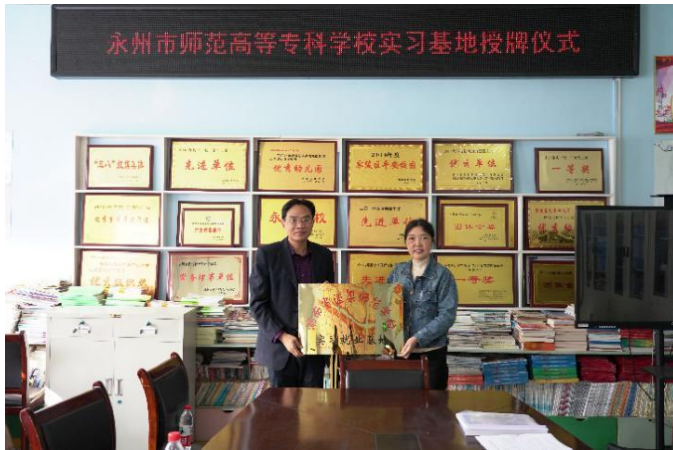
学前教育学院与零陵机关幼儿园签订校企合作协议

校企合作单位已达 356 个，其中挂牌幼儿园实习基地 51 个，五年制大专学前教育定向生实习幼儿园 18 所。未来三年内将在我市每个县（区）新开辟 2-3 个新基地并授牌，建成以永州市区为中心向其它各县（区）幼儿园及周边省份幼教机构辐射的实习基地网络体系，满足学生多轮循环，不同层面见习、实习的需要，实现学校和岗位之间零距离对接的人才培养目标。