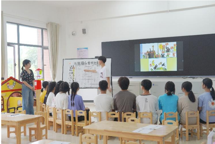
学前教育专业学生在幼儿社会教育仿真教室教学